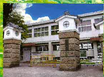
柁城小学校まで約1.4km (徒歩で約18分・車で約4分)