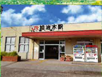
加治木駅まで約1.7km (徒歩で約22分・車で約5分)

近隣には小・中学校をはじめ、高校もあります。またスーパーや多くの店舗・医療施設等も充実しています。陸・空路の交通アクセスも大変良いため、人気のエリアです。