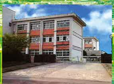
加治木中学校まで約1.2km (徒歩で約15分・車で約3分)